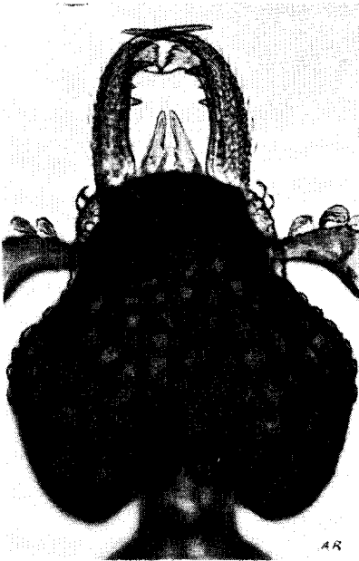
8. Epitritus argiolus Ouvrière G = × 110