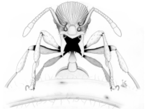
Portada: Lenomyrmex costatus , obrera (Panamá)

Esta obra contribuye al Inventario Nacional de la Biodiversidad de Colombia