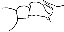
Fig. 4. Tetramorium bicolor Viehm. subsp. n. tricarinatum ♂.

♂. Wie der Typus gefärbt, aber die gelben Teile mehr bräunlich rotgelb, Mandibeln, Scapus der Antennen, Schenkel und Schienen mehr oder weniger dunkel. Kopf kürzer und breiter, mit geraderen Seiten und deutlicheren Hinterecken, in der Form mehr wie guineense F.; zwischen den Stirnleisten mit 3 Längsrippen, die sich nach vorn über den Clypeus fortsetzen, dazwischen mit einigen stark verkürzten schwächeren; Untergrund glänzend glatt. Stielchen in der Form sehr ähnlich, die Rückseite des Petiolusknotens viel deutlicher konkav. — L. 3,2–4 mm. — Rawlinsongebirge.