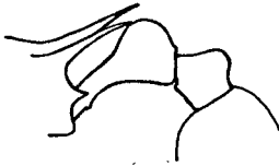
Fig. 3. Tetramorium wagneri n. sp. ♀.

♀. Kopf rechteckig, länger als breit, mit schwach konvexen Seiten und sehr flach ausgebuchtetem Hinterrand. Augen etwas konvex, vor der Mitte, von dem Vorderrand etwa so weit als ihr größter Durchmesser entfernt. Fühlerschaft den Hinterrand des Kopfes nicht ganz erreichend, zweites bis achtes Geißelglied schwach quer; Vorderrand des Clypeus in der Mitte schwach ausgerandet. Mandibeln mit 3 größeren Endzähnen und 4 kleineren, die inneren undeutlich.