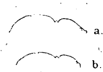
Profil dorsal du thorax de Pre-nolepis madagascariensis For., a type, b var. sechellensis .

11. PRENOLEPIS BOURBONICA Forel, var. bengalensis Forel, in litt. — Mahé, La Digue, Ile-Ronde.