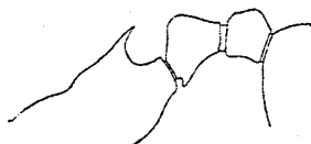
Рис. 13. Myrm. kozlovi subbrevispinosa (♂).

♂. Шипы на заднеспинкѣ короткіе, почти вдвое короче чѣмъ у kozlovi , толстые, зубцевидные, направленные назадъ. Первый узелокъ стебелька короткій, имѣетъ форму тупозакругленнаго конуса. Окраска нѣсколько темнѣе, чѣмъ у mekongi . Скульптура ближе подходит къ mekongi . Дл. ок. 5 mm.