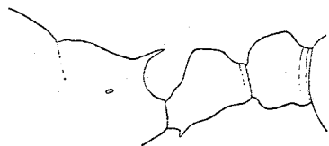
Рис. 16. Myrm. smythiesi , var. bactriana (♂).

♂. Голова полуматовая или лишь слабо блестящая, мелко-морщинистая; на бокахъ лба (между нимъ и глазами) мелкая и частая точчатость. Личной щитокъ гладкій и блестящій. Грудь блестящая или полублестящая, съ продольными штриховатыми