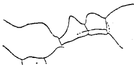
Рис. 28. Messor lobulifer Em. (♂).

Этотъ видъ былъ раньше найденъ Экспедиціей гр. Зичи въ сѣв.-восточной Монголіи. Козловымъ добытъ въ Алашаньской пустынѣ.