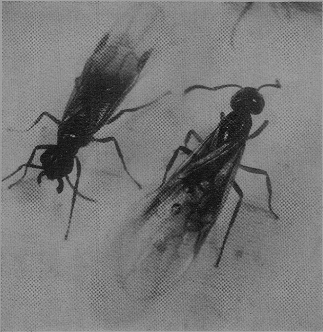
Abb. 16: L. reginae ; geflügelte Weibchen (rechts) und Männchen (links) sind schon ab Juni im Nest zu finden.